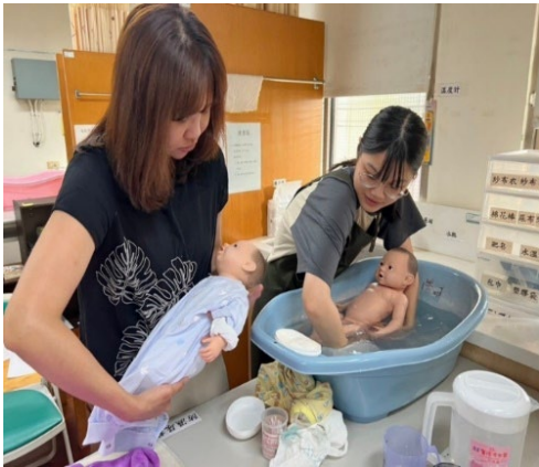
圖 29：幼教系舉辦托育人員考照工作坊

理學院專注於激勵學生參與學術活動，推動學術競賽、證照考試、期刊投稿及專題研究等，強化學生專業能力與創新競爭力。本方案配合高教深耕計畫，提供獎助學金支持，鼓勵學生以自主學習為基礎，積極參與多樣化的學術與專業發展機會。透過這些課程與活動，各學院幫助學生將專業知識轉化為實務技能，並透過校內外資源的結合，為學生的職涯發展與就業競爭力提供了強有力的支持與保障。