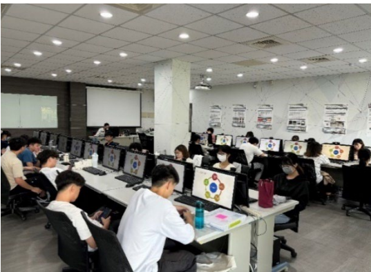
圖 2：探索 AI 未來超能力上課情形

以「少理論、多動手，自主學習」為宗旨，每個學期開設資訊主題相關之微學分課程，並以目前時代趨勢與資訊學院特色之領域為主題，讓學生能初步探索資訊的奧妙，提升學生之資訊科技能力。 113 年因應 AI 人工智慧熱潮，改開設「生成式 AI」主題課程。