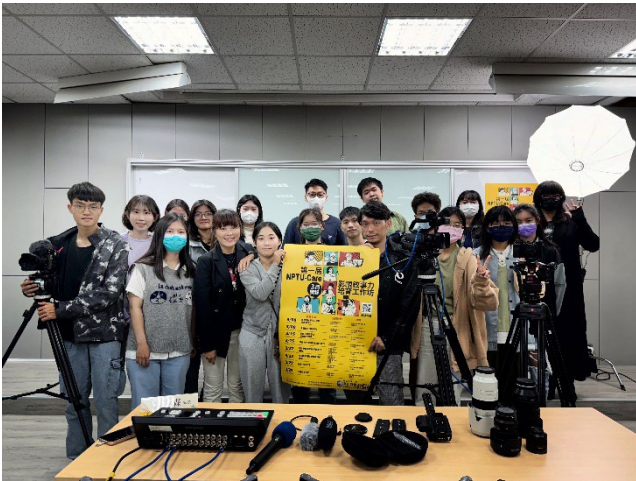
圖 9：邀請業師分享外景打光技巧

的精神。 https://www.youtube.com/channel/UCUL9xA_957KhmEpjm401sYw