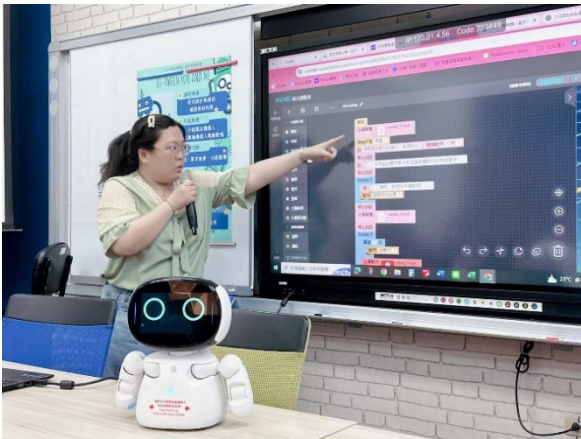
圖 27：運用凱比機器人融入課程 提升學習動機

教育學院因應數位科技融入教育的趨勢，將數位實作課程結合系所發展特色，推動教材開發與實地應用，並拓展至社區與小學場域。學生以科技輔助學習、教學媒體運用等課程為基礎，成功開發諮商 APP、AI 數學文化教材等數位學習媒材，並在國內外競賽與學術發表中獲得多項殊榮，如 AI 教育機器人創新教案競賽佳作及數位學習研討會最佳論文獎等。這些實作課程不僅提升了學生的數位應用與跨領域能力，亦激發其人文關懷與在地實踐精神，為培育兼具專業技能與社會責任感的人才提供了有效的支持與實踐平台。