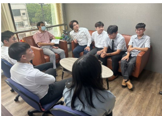
圖24：財金系主任至詠昊保代實習訪視

為持續優化實習課程，學校致力於辦理校外實習獎勵方案，確保學生的學習利益，並鼓勵更多實習機構的參與，進一步深化學生在真實職場環境中的學習與應用能力。