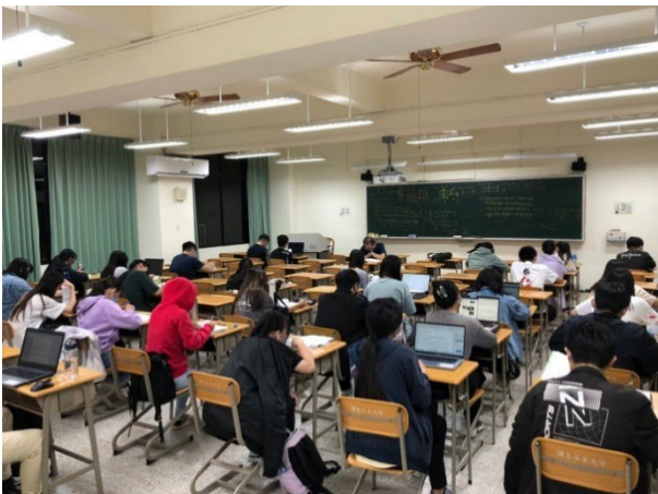
圖 32：課業輔導及諮詢

(2)鼓勵經濟不利學生積極考取專業證照，開設10項資訊技能專業考照班，截至目前止，取得證照獎勵金申請人次共94人；開設100次的課業輔導、50場職涯相關工作坊及20場證照考照班；其中課業輔導方面，每學期安排五位課輔老師，提供經濟不利學生課業相關諮詢，參與人次共387人，申請優良成績獎學金共計129人、成績進步獎勵金共計58人； 總計各類經濟及文化不利學生經濟與生活輔導人數458人。