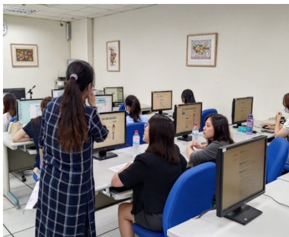
圖 26：GCDF 職涯諮詢師檢視學生施測情形

學生的正面回饋持續增多。大一學生表示，參與活動後更清晰未來方向，並感謝教師的引導讓他們思考人生規劃的重要性；大三學生則認為，透過這些活動更了解自身特質與市場趨勢，對專業技能的提升與未來的職場適應能力有了更強的信心。