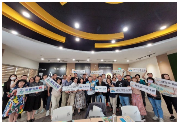
圖 20：USR 及 SDGs 培力工作坊與講座

跨域整合，並加深師生對永續發展目標的認識，增進師生對 SDGs 的了解；2024 年辦理「永續發展的實現路徑：跨域共創與在地實踐」國際研討會，探討學理基礎與跨國經驗，提供永續發展教育政策及實務策略建議。以上活動透過參展、參獎及共培等方式，擴大永續校園的推動效益，並持續提升本校在 USR 實踐上的影響力，為永續發展目標的實現貢獻力量，在「師培 USR」支持下，辦理「師培 USR 藝術教育」論壇，透過在地教育深耕、大學與學校的夥伴協作，以及師培大學內部的跨系所整合與合作，進行跨域與跨單位的專業合作，企圖激發展更為多元的教育想像與創意，為未來師資培育提供更具前瞻性的實踐路徑。