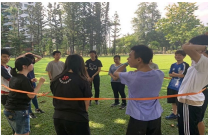
圖 31：經濟不利學生心靈輔導活動