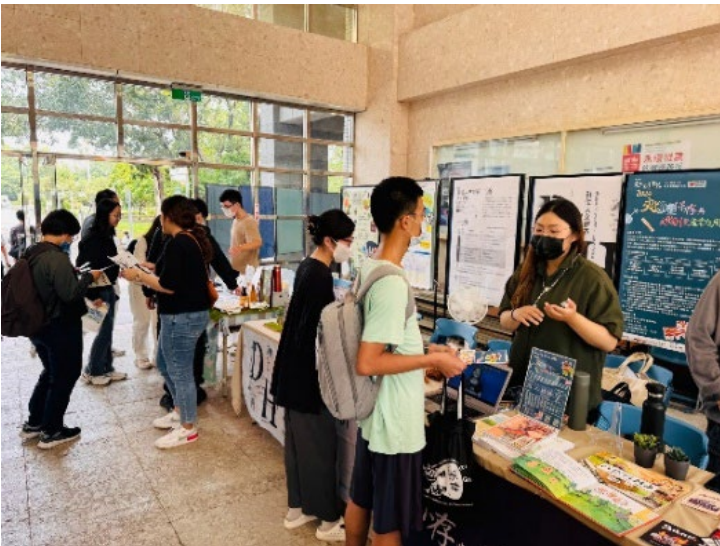
圖 6：113 學年第 1 學期跨領域學分學程/微學程宣傳活動

因應社會與產業發展之需要，推動學生跨領域學習，並善用本校教學資源，提供學生跨領域學習環境，以培養學生第二專長，促進多元學習及就業機會。(1)辦理跨領域學分學程/微學程宣傳活動，深化學生跨領域學習概念，增加學生修讀跨領域學分學程動機。(2)每學年辦理跨領域學分學程評核會議，邀集校內、外跨領域專業委員，針對各學分學程之學生申請及修讀情形、課程開設情形、課程紀錄、學生及教師成效等面向進行專家建議，力求精進各跨領域學分學程課程品質。(3)完成跨領域學分學程 112 學年評核會議，依評核之會議內容作為各跨領域學分學程進行課程內容及相關成效之修正依據。 112-2 學期跨領域學分學程開課共計 123 門，共 87 名教師開課，有 3,039 位學生修讀。 113-1 學期跨領域學分學程開課共計 133 門。