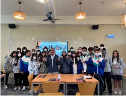
圖 30：至高中辦理招生說明會