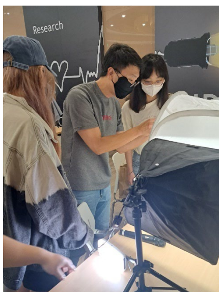
圖 7：學生進行實際操作，進行商品攝影企畫、拍攝與修圖，以及電商網站設計與佈置

113 年度實作導向業界專家共時授課方案，有效提升學生學習動機和實踐操作能力，為學生的未來發展奠定堅實基礎。特色課程有商業自動化與管理學系的「虛擬商店管理」課程，邀請嶺瀚文創事業有限公司企劃部總監共授，規劃：(1)商品攝影基礎與企劃、(2)商品攝影技巧教學、(3)商品實務拍攝、(4)商品修圖與上架網站等四大教學主題；本課程的教學理念是以 Kolb (1984) 提出的體驗學習理論為基礎，強調學習者通過實際操作、反思、理論概念化和應用這四個階段來達到知識內化和技能提升的目的。透過本課程計畫，學生學習動機提升，對學習的興趣和投入度大幅增加，願意投入更多時間理解和掌握課程內容。此外， 學生實踐操作能力增強，學生參與商品攝影、網站規劃與建置等活動中，提升了實際操作技能，學會如何應用理論知識解決實際問題。