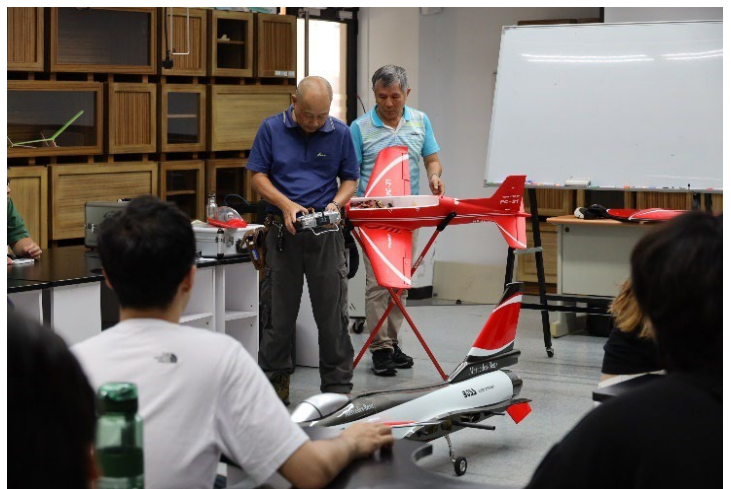
圖 16：科學創新與製造上課紀實