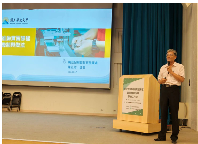
圖 25：分享推動實習課程之相關機制與做法