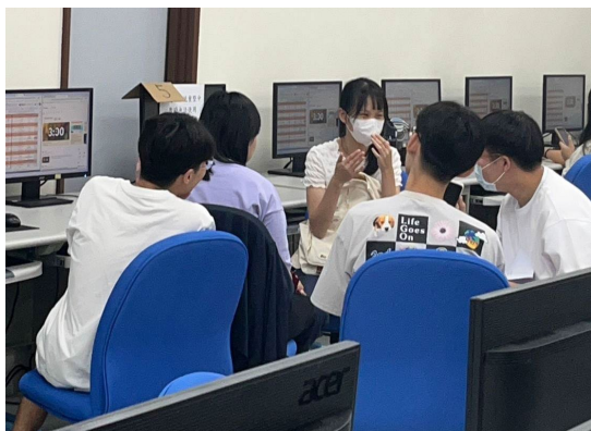
圖 3：同儕之間彼此交流討論

推動教師針對教學現場問題，輔以相關文獻探討與觀察提出適當解決教學現場實務問題之方法，運用教學方法改善教學現場問題，例如：建構案例學習以提升學生學習動機與實作能力、生物醫學與健康學習、遊戲化教學應用於高等物理化學課程，採用合作學習法、行動研究法、問卷調查法等，以有效檢視教學研究資料，回應提出之研究問題，並於課程期末發表與分享學習成果。執行本方案教師須申請隔年度教育部教學實踐研究計畫。