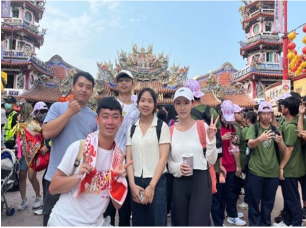
圖 17：學生參與祖繞境活動了解節慶活動舉辦的重要性

強化學生學習成效，實現學生社會參與，進一步深化大學與地方鏈結，113 年邀請屏東縣市 9 所幼兒園學童參加三部曲並至三地門地磨兒國小附幼及霧台鄉霧台國小附幼演出「都是紅孩兒惹的禍」，透過戲劇演出的方式，提供學童一個豐富的文化體驗，並啟發他們對藝術的興趣與熱愛。本校「社會企業與公益創新」跨領域學分學程，教學團隊引導學生自主參與校外社會行動、企劃提案與職場體驗，結合課堂教學與實地踏查，協助學生發揮潛力與創意，回應多元社會公益需求，提升社會責任感與公民意識；在實務之外，亦 鼓勵學生以再生能源、社會參與及地方治理等社會議題進行學術研究，並於 113 年獲國科會大專生專題計畫通過 3 案。