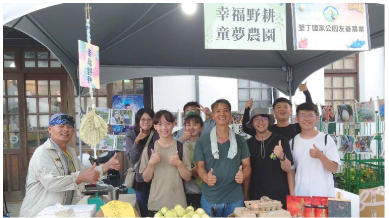
圖 28：社會發展實作課程至恆春半島訪調 有機小農，參與當地市集