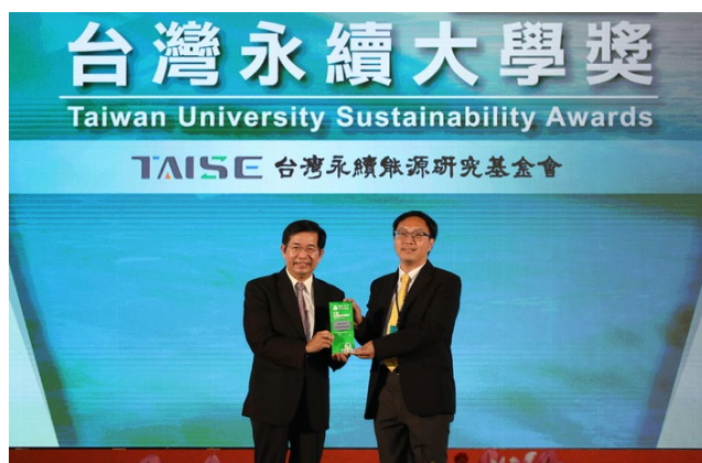
圖 21：屏東大學榮獲 2024 永續大學獎 綜合績效 績優獎

積極推動公平教育、低碳校園和生物多樣性，本校榮獲 2024「台灣永續大學獎」榮獲綜合績效類績優獎，展現其在環境永續、社會公益與大學治理三大面向的卓越表現，在《遠見》2024 年台灣最佳大學排行榜的「綠能大學評比」中位居第一名，並在 USR 大學社會責任獎中，亦獲得「人才共學組楷模獎」的殊榮。在 TSAA「台灣永續行動獎」中表現卓越，2024 年更獲得 1 金、2 銀、1 銅，質與量在全國大學中名列前茅。在《泰晤士高等教育》世界大學影響力排名（THE Impact Rankings）中，屏東大學表現優異。