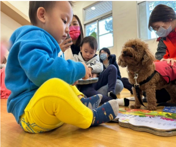
圖 19：辦理假日親子共讀活動

本校擁有特殊教育與師培專業的師資、學生、課程，本校積極整合相關資源推動溝通訓練服務學習機制，教師指導並帶領學生走進高屏地區中小學及偏鄉、社區圖書館、身障成人與老人服務據點推廣閱讀活動，113 年辦理假日親子共讀活動 2 場 50 人次，113 年與屏東勝利之家合作辦理系列課程活動共 22 場次。本校近年來持續與高屏縣市教育局合作，培訓學習輔助犬種子教師，113 年與本校諮商中心暨資源教室共同辦理「我與學習輔助犬的小時光」，共辦理 48 場次。113 年提供特殊需求兒童溝通訓練服務共計 24 位，服務 224 人次，協助特殊需求的學童及身心障礙者能夠提升學習動機、獲得學習成就感，同時透過與輔助犬的互動，推廣生命教育。