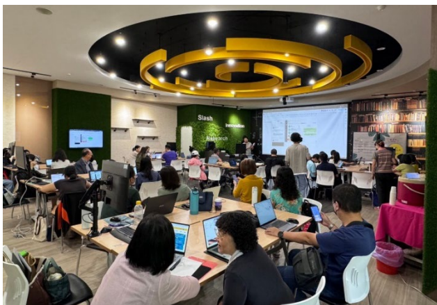
圖 8：辦理「AI 共舞：啟航學習策略的奇幻旅程！」講座

第二期遠距課程數位教材補助計畫，針對遠距教學開課所規劃錄製的多媒體自主學習教材，補助其製作數位課程之錄製鐘點費、教材費、數位 TA 工讀費，協助老師製作遠距數位教材，並協助參與課程活動、帶領線上討論、線上輔導及其他數位教學相關活動之協助，以吸引更多教師將實體課程轉化為線上數位模式進行教學；另外，教學發展組於 113 年暑期辦理「113 年遠距數位教材設計與製作實務工作坊」，於 113 年 8 月 21 日辦理「與 AI 共舞：啟航學習策略的奇幻旅程！」活動，參與師長共 31 人、教職員共 12 人，活動滿意度達 4.96，透過講座交流及實務操作後能充份了解運用 AI 數位學習策略，為未來的數位教育發展提供實踐建議與創新思維；於 113 年 8 月 27 日辦理「春風化雨-談中正大學教學專業發展數位學習碩士在職專班辦學經驗分享」活動，參與師長共 62 人、教職員共 39 人，活動滿意度達 4.76，透過講座交流及經驗分享，為未來的數位教育發展提供實踐建議與創新思路，並持續鼓勵。