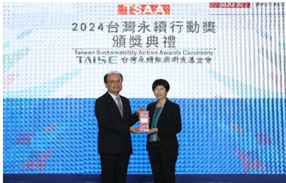
圖 22：國立屏東大學在 TSAA「台灣永續行動獎」中表現卓越