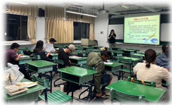
圖 33：教師檢定讀書會

(6)與校內外職涯相關單位合作，邀請各職場領域原民青年及技術職能講師等，分享自身經歷並提供職業諮詢，使學生更了解自己屬性並規劃未來職場方向。截至目前為止，辦理職涯系列講座、職場體驗及參訪等共5場188人次參加，將持續辦理職輔課程3場。