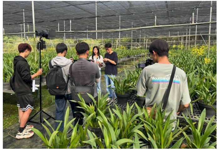
圖 10：自媒體實作 A 組至屏東竹田外拍