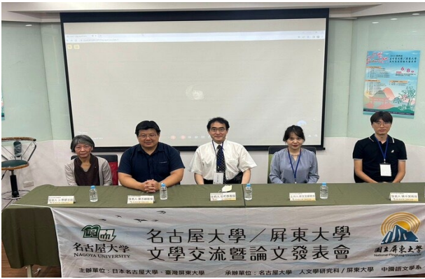
圖 18：2024 第四屆名古屋大學屏東大學文化交流暨論文發表會