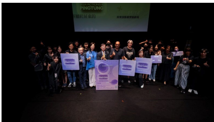
圖 23：2024 ACTIONS x Pingtung

113 年活動進一步轉型， 創立自有品牌平台「ACTIONS x Pingtung」 。活動以行動實踐為核心理念，藉由「ACTIONS」象徵屏東的多元性與活力，推動在地文化與永續發展議題，活動不僅強調行動力，更聚焦於屏東的在地文化特色，融合當地自然與人文資源，致力於創造一個匯聚各方資源的平台。同時，活動與屏東縣政府等單位合作，逐步塑造屬於屏東的文化交流平台，為未來的活動規劃和資源投入創造更多可能，期望能吸引更多關注與參與，共同推動屏東的永續發展，並促進跨域人才的交流與合作。